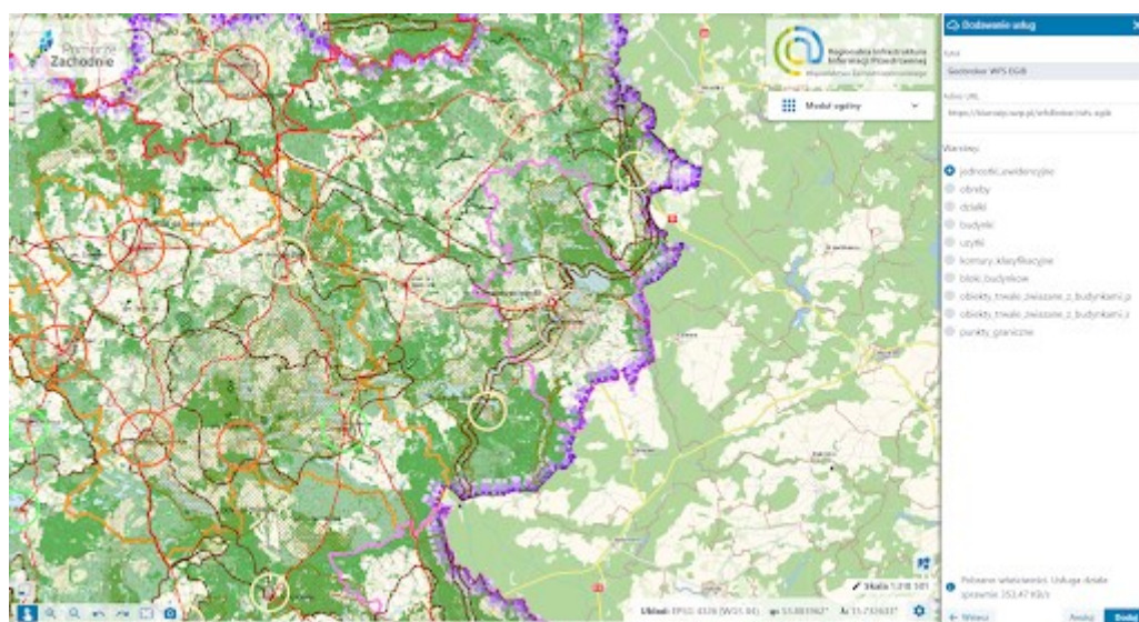
Zdjęcie nr 3 – Podłączanie usługi sieciowej WFS do mapy

Oparcie Portalu RIIP WZ na usługach sieciowych umożliwia różnorodną prezentację graficzną zgromadzonych danych poprzez wygenerowanie warstw, które są w obszarze zainteresowania użytkownika.